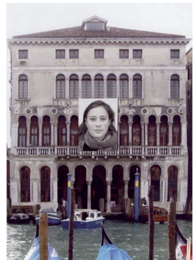
Braco Dimitrijevic, Future Post History

O módulo Arsenale, para nossa alegria e orgulho, começa com uma instalação da vanguardista brasileira Lygia Pape, nascida em Nova Friburgo, em 1927 e falecida no Rio de Janeiro, em 2004. Ela está presente com “Laços Dourados” e “Formas Quadradas”, graças ao Projeto Cultural Lygia Pape, com fotos de Paula Pape e contribuição de colecionadores. Não era de se surpreender que uma artista tão importante como Lygia Pape para a arte contemporânea brasileira nos representasse assim muito bem. Outro destaque brasileiro é o internacionalmente reconhecido Cildo Meireles, com seu labirinto com espaços coloridos combinados com touch screen ou monitores que dão o tom da cor em cada espaço. Finalmente, o vídeo da Sara Ramo, espanhola radicada no Brasil, exatamente em Belo Horizonte, com seu jogo de bola e parede em brown-stone (paredes em tijolinhos), ao lado dos espanhóis Vives e Bastué, justifica a presença dos vídeos em bienais internacionais. A apropriação de um apartamento todo vedado, tão interessante como o jogo de bola e paredes da espanhola naturalizada brasileira e mineira, são mesmo referências em termos de vídeos. Por sua vez, Mark Lewis e Steve McQueen justificam a presença dos curta-metragens. Eles são do Canadá e da Inglaterra. Inaugurada a 7 de junho, a Bienal Internacional de Veneza, a 53ª. edição, esteve em cartaz até o dia 22 de novembro, um domingo. Apesar de percalços, valeu à pena uma visita aos espaços da Bienal, mesmo que em última chamada.